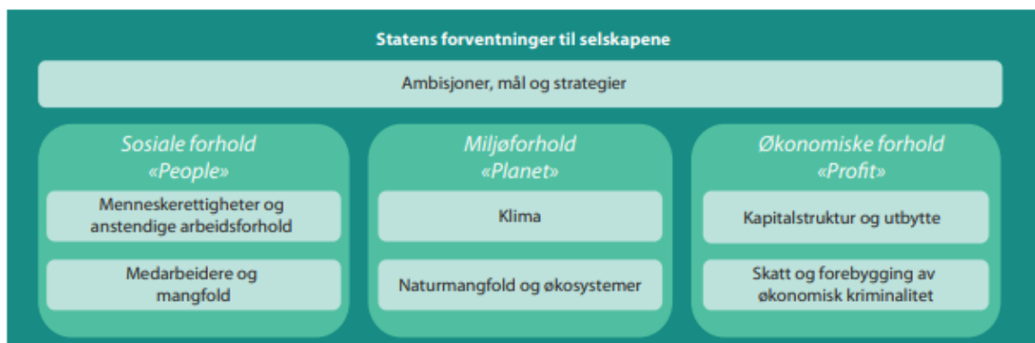
Figur 1 Statens forventningar til selskapa

Gjennom Eigarskapsmeldinga St.6 (2022-2023) stiller staten krav og forventningar til at verksemdar som er eigd av staten er leiande i arbeidet med ansvarleg verksemd. Staten sitt mål som eigar er at verksemdar i spesialisthelsetenesta har ei bærekraftig drift, og er mest mogleg effektiv i arbeidet med å oppnå helsepolitiske mål. Eigarskapsmeldinga inkluderer ambisjonar, mål og strategiar innan sosiale tilhøve, miljø og økonomi.